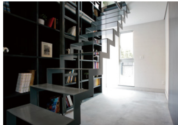
多用途に使用できる広い玄関ホール。吹き抜け沿いには高さ5.3mもの壁面書棚。本だけでなく、さまざまな収納を楽しめます。