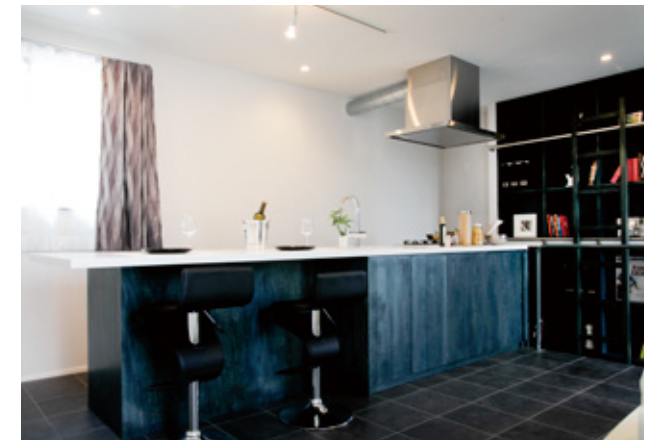
キッチンの面材や建具は「ブルーグレー」で塗装しています。その独特の色味は写真では表現できない魅力があります。ぜひ実物をご覧ください。