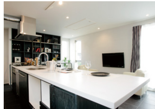
ワークスペースも兼ねた幅375cmのオーダーキッチン。食器洗浄機やビルトイン浄水器など、設備も充実。