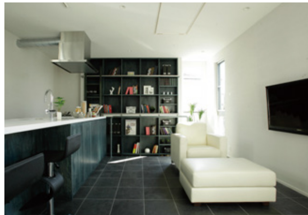
広々LDKは自然素材を使った左官仕上げの塗り壁。タイル貼りの床には床暖房を完備。

【所在地】江戸川区本一色1丁目11番24号 【交通】JR総武線「新小岩」駅徒歩9分 【用途地域】第一種住居地域 【土地面積】40.13㎡、9.18㎡(私道分) 【土地権利】所有権 【建物面積】53.82㎡ 【建物構造】木造二階建陸屋根 【建築年月】平成26年2月 【建ぺい率】60% 【容積率】200% 【接道】東公道に5.5m接続 【取引態様】媒介