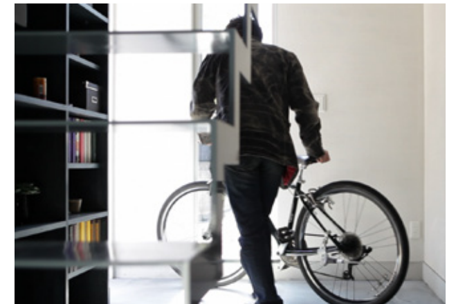
明るく気持ちのいい玄関は、自転車やアウトドア用品を納めたり、趣味を楽しむのに十分なスペースがあります。