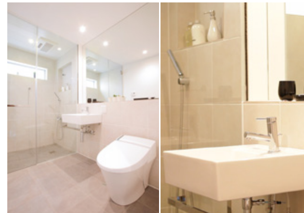
サンタリーは動線を意識し、スタイリッシュにまとめています。浴室には猫足のバスタブを追加しました。