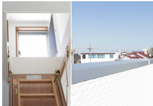
2階の天井に収納されたハシゴを上ると…景観の良いルーフバルコニーが広がります。