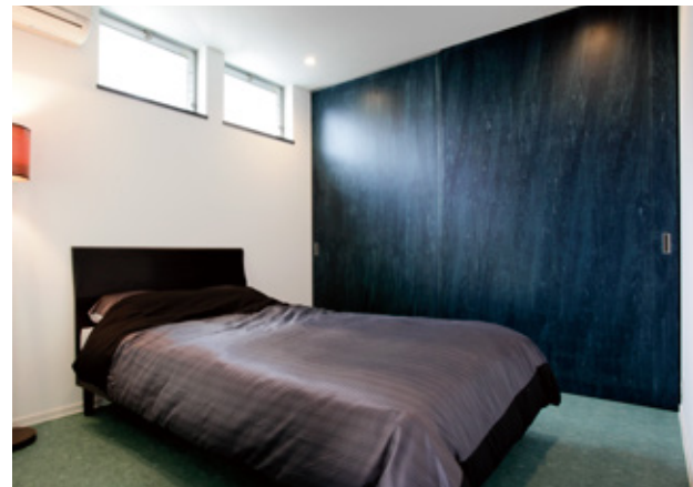
シンプルな洋室の収納引き戸はオリジナル制作。